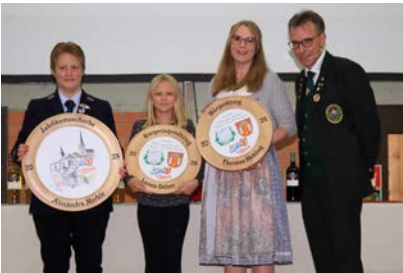
Preisverteilung des Bürgerschießens