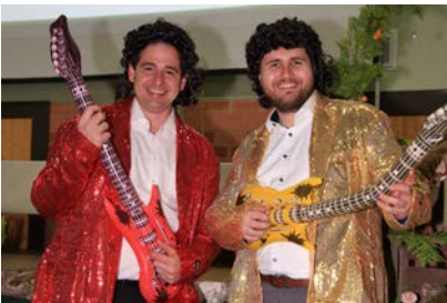
Musikalisch-komödiantischer Auftritt der „Flobbers“