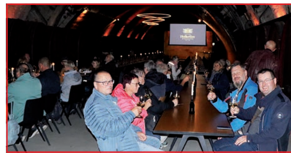
Weinprobe bei der Führung in der Hofkellerei der Residenz