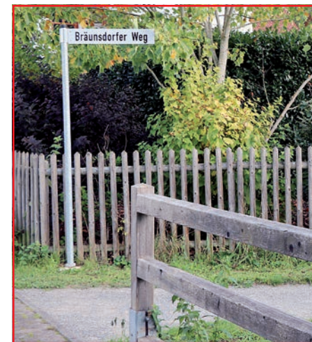
Der Bräunsdorfer Weg führt von der Hofstraße vorbei an der Einheitsbrücke bis zum Park St Cyr.