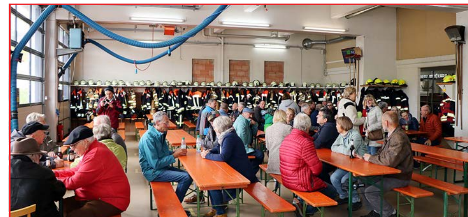
Nach der Einweihung des Bräunsdorfer Wegs am Sonntag ludt die Feuerwehr Unterleinach zum gemeinsamen Mittagessen und Beisammensein im Feuerwehrgerätehaus ein.