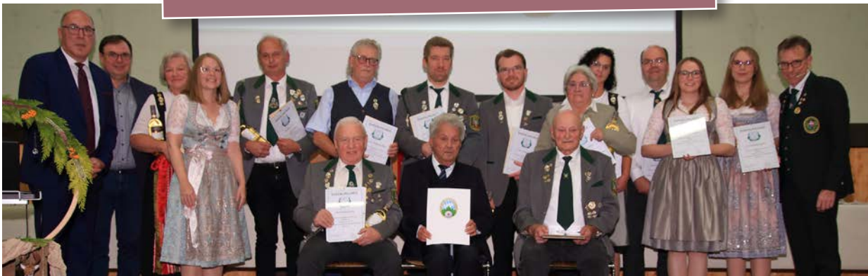
Ehrung der langjährigen Mitgliederinnen und Mitglieder der SG Diana Leinach