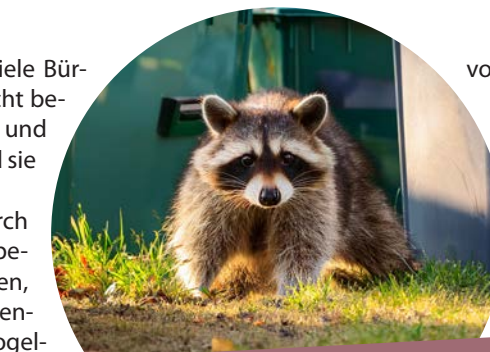
Leinachs heimliche Mitbewohner: WASCHBÄREN

Waschbären sind sehr putzig anzusehen, aber neben den Schäden an Haus und Hof vor allem eine echte Gefahr für unser Ökosystem. Sie können perfekt klettern (daher auch Hauswände und Regenrinnen erklimmen) und mit ihren handartigen Pfoten in kleine Löcher greifen und somit Nester und Gelege ausnehmen, oder auch Deckel/Kästen öffnen, Gitter anheben und sogar Katzenklappen aufbrechen. Aktuell pflücken sie bevorzugt Obst