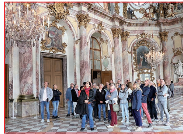
Bräunsdorf-Leinacher Besichtigung im Kaisersaal der Residenz