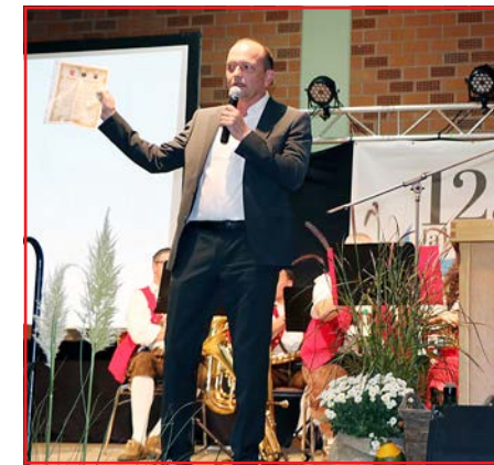
Gert Härtig, OB Limbach-OF/Bräunsdorf