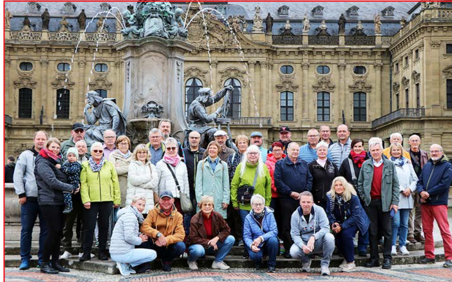
Treffpunkt zur Residenzführung: Die Besucher aus Bräunsdorf, St-Cyr-du-Roncay und Leinach versammeln sich zum Foto am Frankoniabrunnen vor dem Würzburger Weltkulturerbe.

Der Besuch einer Gruppe mit 21 Bräunsdorferinnen und Bräunsdorfern beweist, dass diese Partnerschaft lebt. Heißt es doch in der Partnerschaftsurkunde: „Die Orte Bräunsdorf und Leinach beschließen